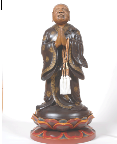
延上 り 日延 本尊